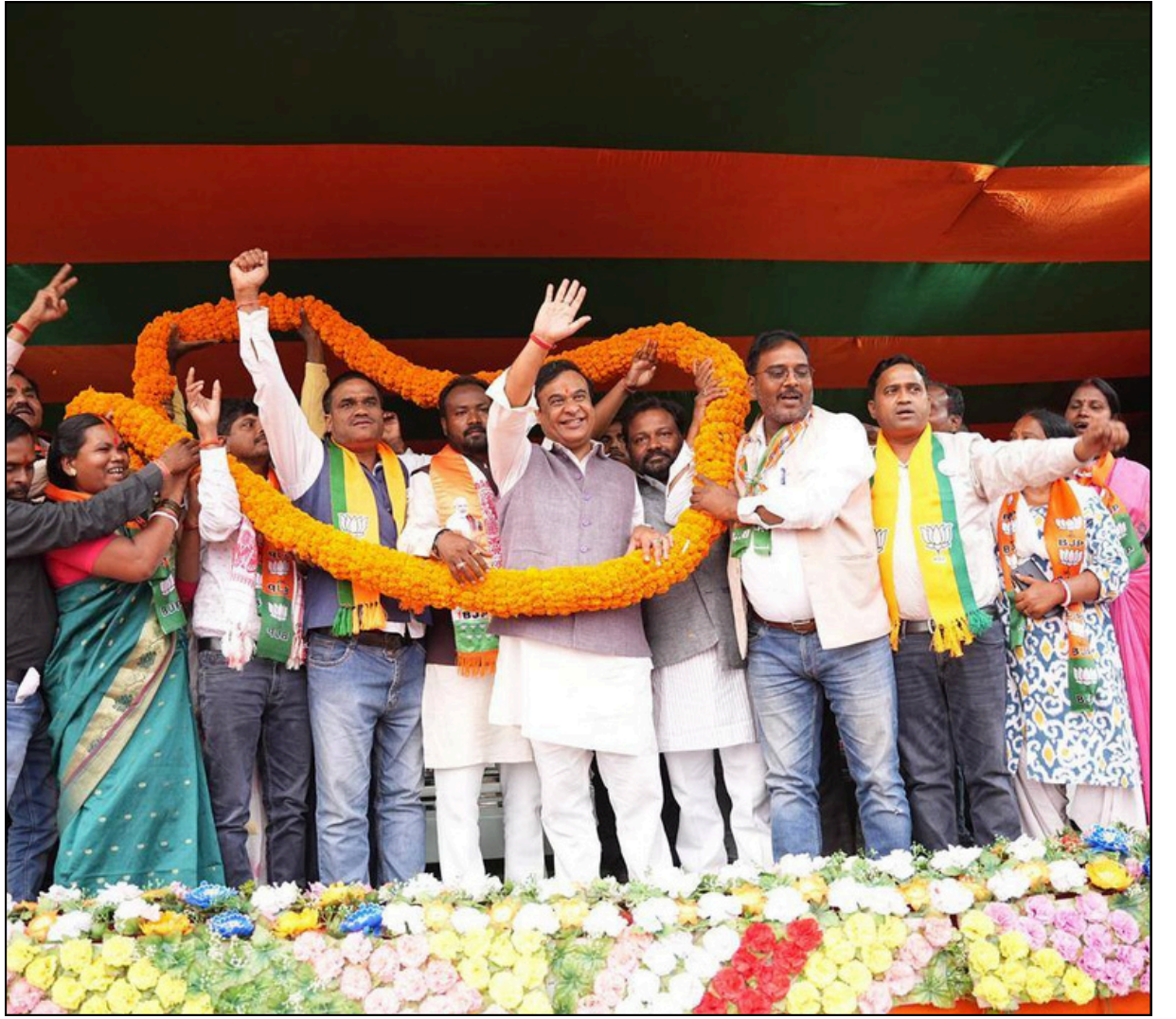
ৰাৰখণ্ডত অসম মুখ্যমন্ত্রী ড० হিমন্ত বিশ্ব শৰ্মাক উদ্বা আদৰণি, ফটো শনিবাৰৰ