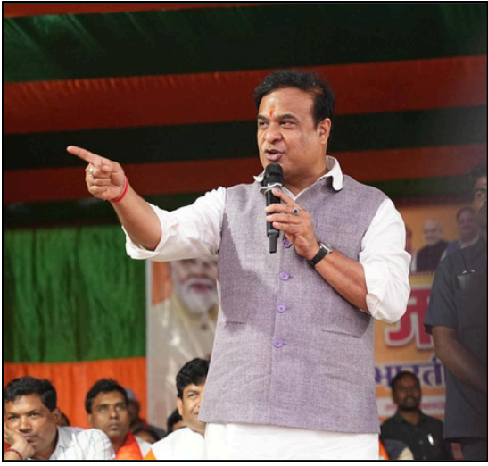
দিবনে ভোট বিজেপিক? ফটো ৰাৰখণ্ডৰ